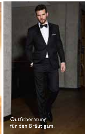
Outfitberatung für den Bräutigam.