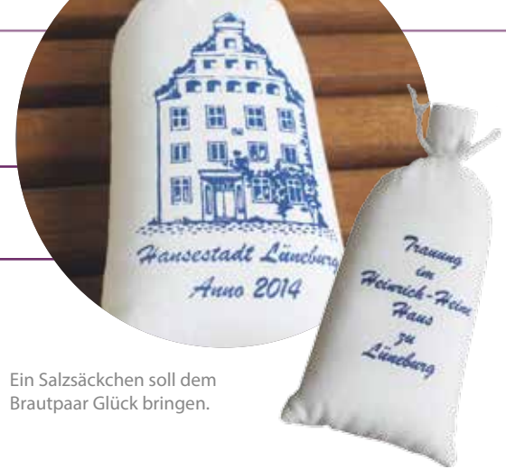
Ein Salzsäckchen soll dem Brautpaar Glück bringen.

Vor dem großen Ereignis steht die Anmeldung der Eheschließung. Frühestens sechs Monate vor Ihrem geplanten Hochzeitstermin können Sie die Anmeldung bei Ihrem Wohnsitzstandesamt vornehmen. Eine Terminreservierung für Ihre Hochzeit nehmen wir natürlich auch schon früher entgegen!