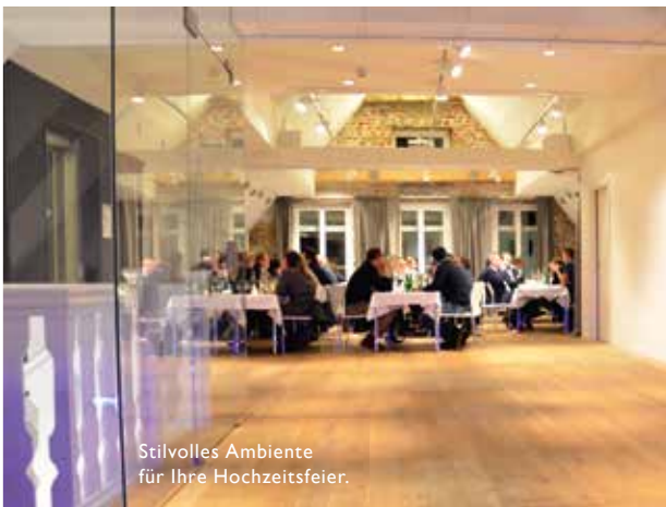
Stilvolles Ambiente für Ihre Hochzeitsfeier.