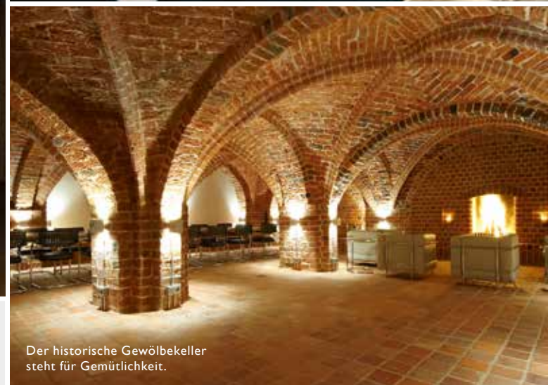
Der historische Gewölbekeller steht für Gemütlichkeit.