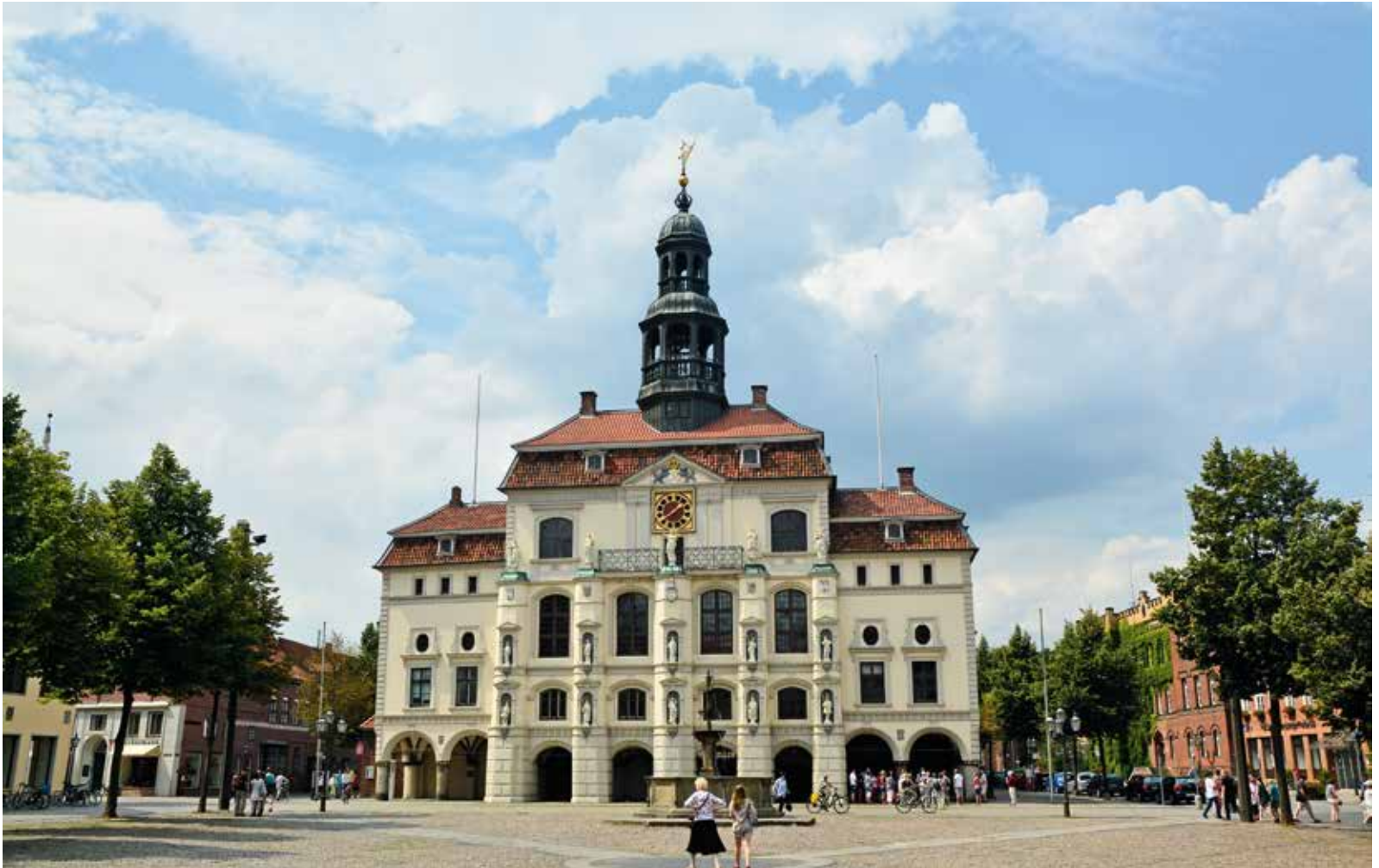
Auch wenn die barocke Fassade anderes vermuten lässt: Das Rathaus (oben) gehört zu den ältesten Gebäuden Lüneburgs.