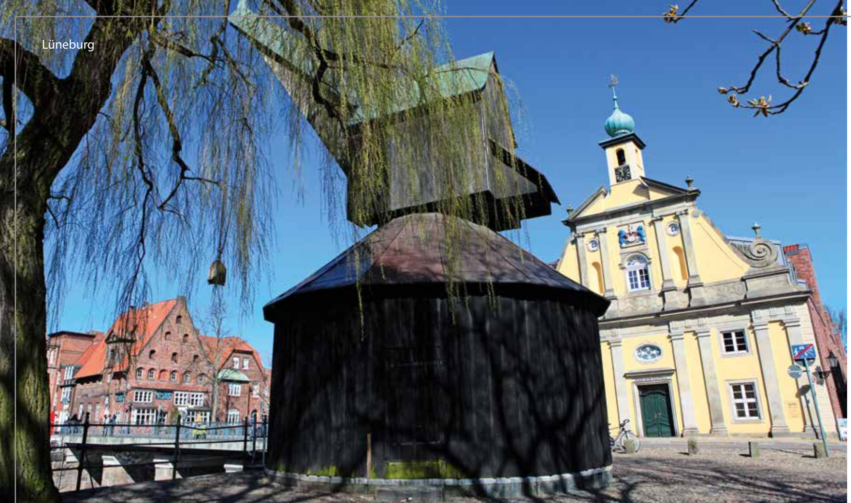
Zwei Wahrzeichen der Hansestadt Lüneburg: Der Alte Kran und gegenüber des Alte Kaufhaus. Rechts der Stint, wo sich ein Lokal an das nächste reiht und herrliche Sitzplätze direkt am Wasser auf Gäste und Einheimische warten. Unten sind die großzügigen Dimensionen des Platzes Am Sande zu erkennen.

Bei einer Führung durch das Rathaus, das den Marktplatz bestimmt, begibt sich der Gast auf eine Zeitreise durch die Jahrhunderte, denn seit den Anfängen im Jahr 1230 hat sich das Bauwerk immer wieder verändert, es wurde vergrößert und dem jeweiligen Zeitgeschmack angepasst, wie zum Beispiel die barocke Fassade zeigt, die das Rathaus erst seit 1704 schmückt. Mittwochs und samstags ist der große Platz vor dem Rathaus mit seinem Wochenmarkt auch heute noch ein beliebter Treffpunkt in der Stadt, wo frische Lebensmittel aus der Region eingekauft werden, der aber ebenso für einen kleinen Schwatz mit dem Marktbesucher oder Freunden und Bekannten der ideale Ort ist.